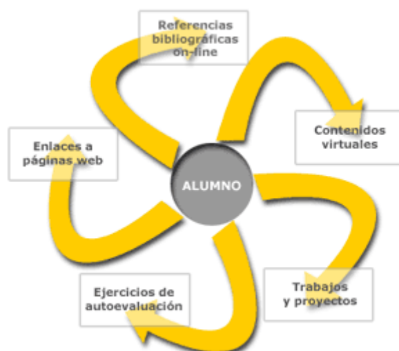
Figura 1. Metodología del CEVUG centrada en el alumno

(ver Figura 1). También se ha relacionado el concepto de crédito ECTS con el de crédito virtual utilizado en los cursos propios del Centro, ambos basados en las horas de trabajo del estudiante.